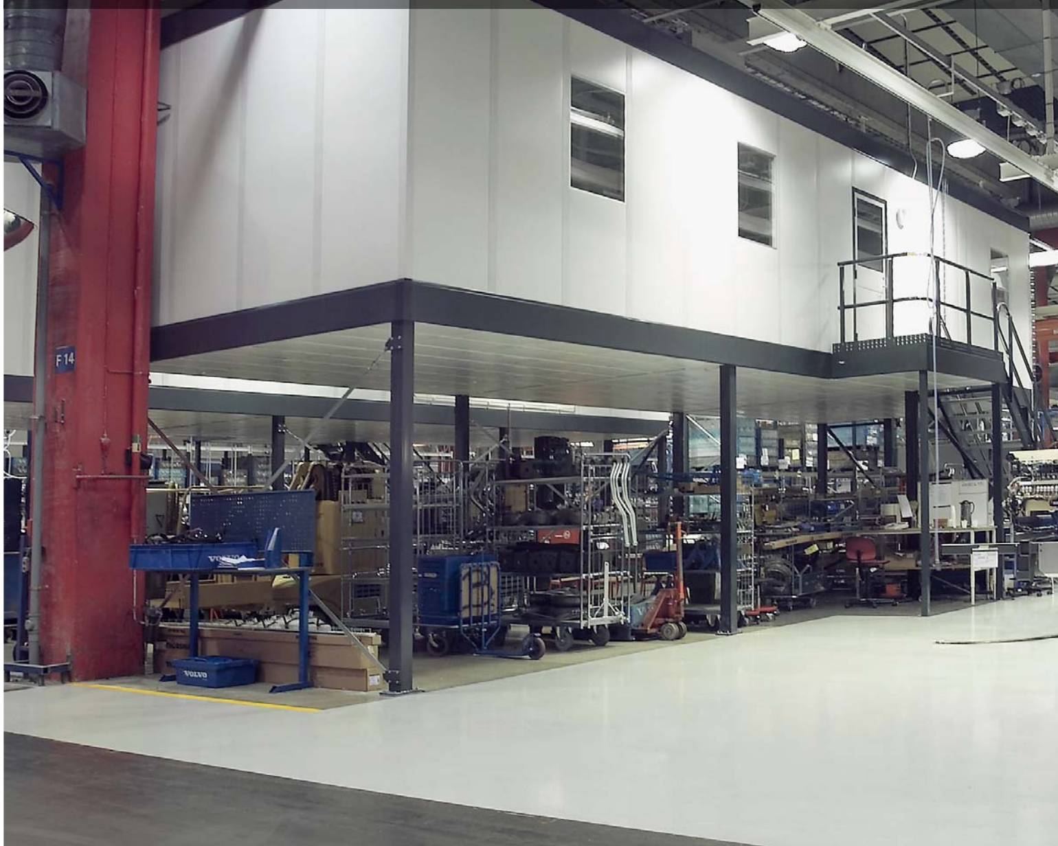
Plate-formes – Systèmes de cloisons – Cloisons grillagées